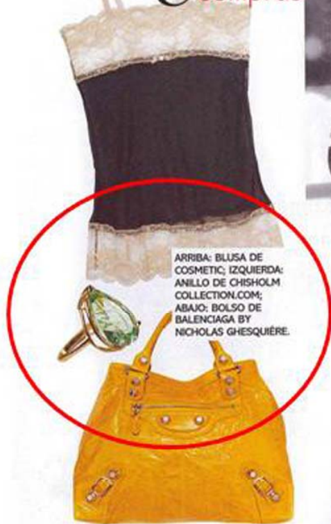
ARRIBA: BLUSA DE COSMETIC; IZQUIERDA: ANILLO DE CHISHOLM COLLECTION.COM; ABAJO: BOLSO DE BALENCIAGA BY NICHOLAS GHESQUIÈRE.