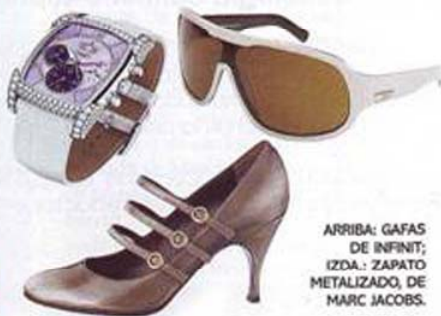
ARRIBA: GAFAS DE INFINITI; IZDA: ZAPATO METALIZADO, DE MARC JACOBS.