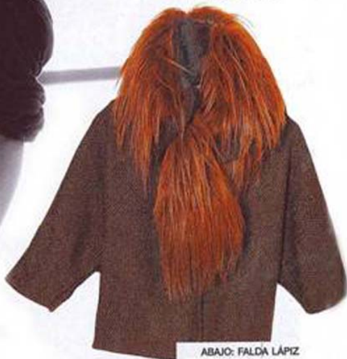
ABAJO: FALDA LÁPIZ CON CIERRES, DE JUNYA WATANABE PARA COMME DES GARÇONS.