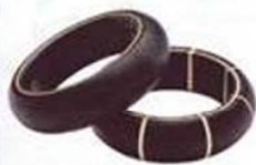
ARRIBA: BRAZALETES DE BOSS BLACK EN HUGO BOSS; ABAJO: SUETER CON CUELLO DE PLUMAS, DE ETRO.