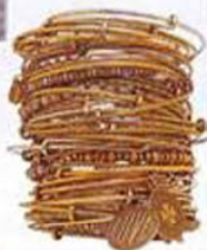
ARRIBA: BRAZALETES DE ALEX & ANI; ABAJO: RELOJ CON CORREA DE CUERO Y BRILLANTES, DE PARMIGIANI.