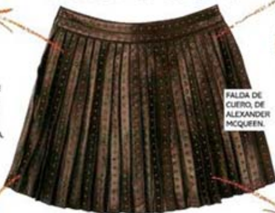
FALDA DE CUERO, DE ALEXANDER MCQUEEN.