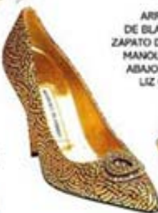
ARRIBA: BOLSO DE BLAQUE; IZDA: ZAPATO DE RASO, DE MANOLO BLAHNIK; ABAJO: ANILLO DE LIZ CLAIBORNE.