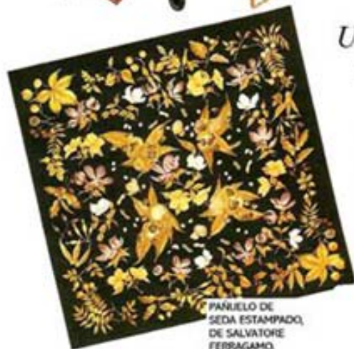
PAÑUELO DE SEDA ESTAMPADO, DE SALVATORE FERRAGAMO.

La posibilidad de estilizar el cuerpo haciendo lucir las piernas más largas es una ilusión que ninguna top model o mortal quiere dejar pasar. Para la nueva temporada, la falda de tablas deja de ser un "uniforme escolar" o una pieza para jugar al tenis para llenar las noches de esplendor... El diseñador Alexander McQueen ha refinado la minifalda con pliegues en una versión más roquera de cuero con remaches en metal, para lucirse a toda hora con unos stiletto , que le añaden un toque sumamente sexy y atractivo. —K.M.R.