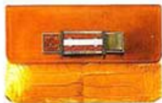
ARRIBA: CARTERA DE MARC JACOBS; IZDA: LLAVERO CON DUES EN FORMA DE CALAVERA, OSO Y CORAZÓN, DE PRADA.