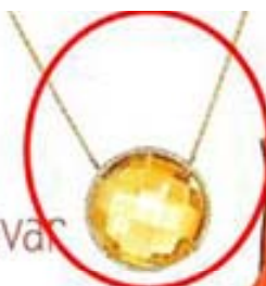
ARRIBA: ANILLO DE GARRARD; MAS ARRIBA: COLLAR DE CHISHOLMCOLLECTION.COM; DCHA: BLUSA DE PAULE KA.